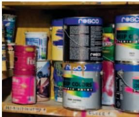
PRODUCTOS DE PINTURA