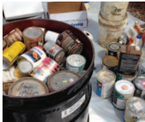
TINTES Y SOLVENTES