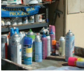
AEROSOL Y ADHESIVOS

Estos son algunos de los artículos aceptados en el Centro Comunitario de Recolección de Residuos Peligrosos. Consulte la lista de Tarifas de Eliminación para las Empresas.