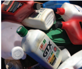
LÍQUIDOS DE AUTOMÓVIL