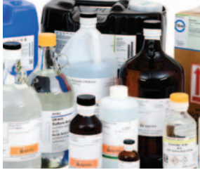
QUÍMICOS DE LABORATORIO