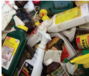
QUÍMICOS DE JARDINERÍA